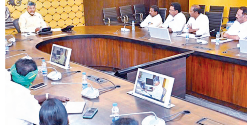
గురువారం సచివాలయంలో దళిత ఎమ్మెల్యేలతో భేటీ అయిన సిఎం చంద్రబాబు

ఉపకులాలన్నిటికీ దామాషా ప్రకారం సమాన అవకాశాలు జిల్లా యూనిట్ గా వర్గీకరణ అమలు గెలిపించిన ప్రజల కోసం పనిచేయండి దళిత ఎమ్మెల్యేలతో భేటీలో సిఎం చంద్రబాబు విజయవాడ, నవంబరు 7, ప్రభాతవార్త ప్రతినిధి: దళిత ఎమ్మెల్యేలతో ముఖ్యమంత్రి చంద్రబాబు నాయుడు సచివాలయంలో సమావేశమయ్యారు. ఎన్నో వర్గీకరణ విషయంలో తీసుకోవాల్సిన చర్యలపై కౌటమిప్పాళ్ల దళిత ఎమ్మెల్యేలతో ముఖ్యమంత్రి చర్చించారు. వర్గీకరణ అమలు ద్వారా దళితుల్లోని ఉప కులాలందరికీ దామాషా ప్రకారం సమాన అవకాశాలు కల్పించి వారికి ఊతం ఇస్తేలా పనిచేయాల్సిన అవసరం ఉందని సిఎం అన్నారు. వర్గీకరణపై సుప్రీం కోర్టు తీర్పుతో పాటు... ఎన్నికల హామీ కూడా ఉన్నందున కార్యచరణపై ఎమ్మెల్యేలతో సిఎం చర్చించారు. జనాభా దామాషా వర్గీకరణ జిల్లా ఒక యూనిట్ గా వర్గీకరణ అమలు చేస్తామన్నారు. సమైక్య ఆంధ్రప్రదేశ్ లో ఉన్నప్పుడు వర్గీకరణ అమలు చేశామని... తరువాత న్యాయ సమస్య కారణంగా ఆ కార్యక్రమం నిలిచి