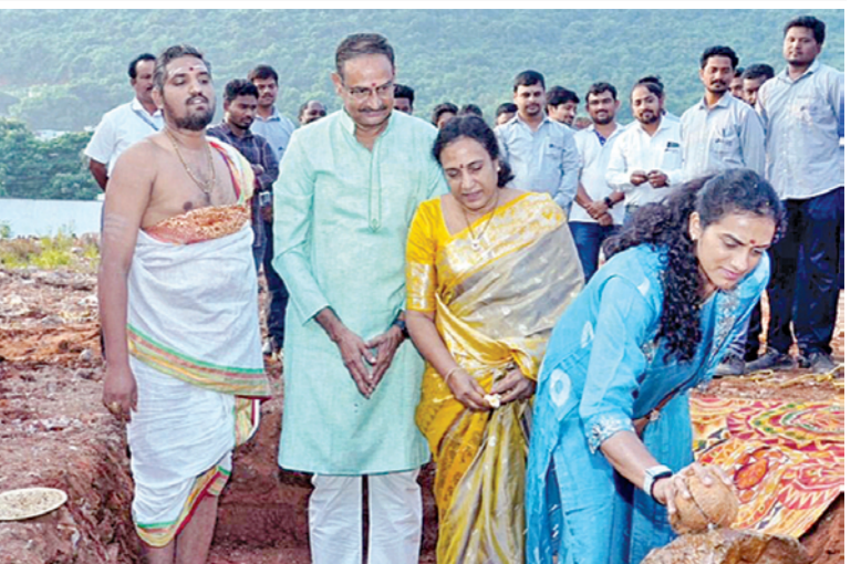
గురువారం విశాఖలో బ్యూడ్జెట్ లో అకాడమి శంకుస్థాపన కార్యక్రమంలో పివి సింధు

నిర్ణయాలు తీసుకున్నారు. పౌర సంబంధాలశాఖ మంత్రి కొలను పార్థసారథి వాటిని విలక్షిత సమావేశంలో వెల్లడించారు. ప్రభుత్వం ప్రైవేటు భూములు అక్రమించుకోవడం ఎక్కడో దూరంగా ఉంటున్నవారి భూములను కళ్లు చేయడంపెదల భూములు లాక్కోవడం నకిలీతలతో వివిధవిధాలు నిర్మించారు. 1982 ను రద్దు చేసి, దాని స్థానంలో ఏమీ భూ అక్రమణల నిరోధక చట్టం - 2024 అమలుకు సంబంధించిన బిల్లు ప్రవేశపెట్టే ప్రతిపాదనకు ఆమోదం. పాత చట్టం చట్ట ప్రాంతాల్లోని అనుభవం పరిమితమైంది. పలు ధ్వారా రూ.5వేల వరకు జరిమానా, ఆర్డెలు నుంచి ఐదేళ్ల వరకు జైలు శిక్ష విధించేందుకు అవకాశం ఉంది. కొత్త చట్టం ప్రకారం రాష్ట్రంలోని అన్ని ప్రాంతాల్లో భూముల కర్షణను మేలుబుంది. అక్రమణదారులకు 10 నుంచి 14 ఏళ్ల వరకు జైలు శిక్ష భూమి విలువతోపాటు నష్టపరిహారం చేసి జరిమానా విధిస్తారు. ప్రత్యేక కేసులు ఏర్పాటు చేసి నిర్ణయం తెలుపడం కేసులు పరిష్కరించేలా చర్యలు తీసుకుంటారు.